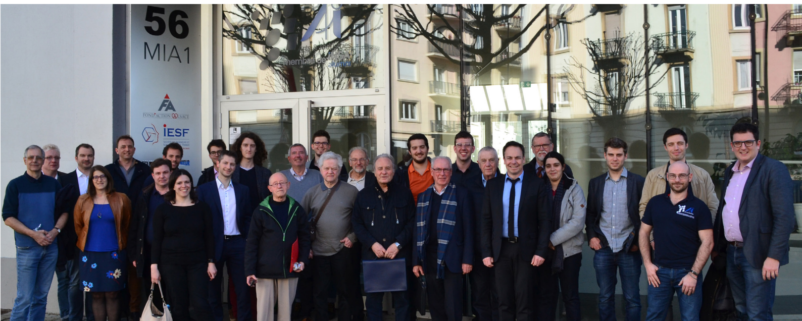
Conseil National du 7 avril 2018 à Strasbourg

Mission accomplie pour l'équipe de Direction de l'association qui souhaitait toucher le plus de membres avec cet évènement !