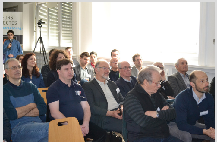
Membres Arts & Industries