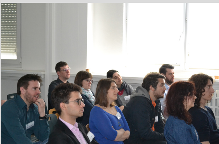
Membres Arts & Industries