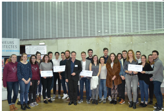
Remise du Grand Prix A&I 2018 à l'INSA Strasbourg