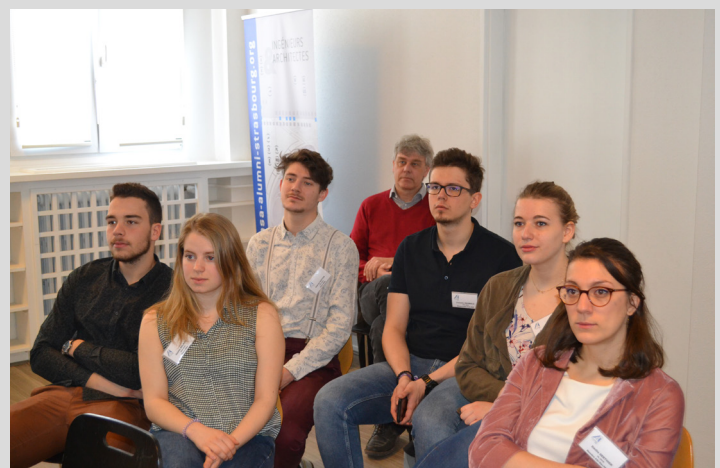
Membres Arts & Industries