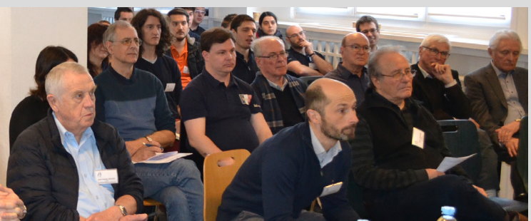
Membres Arts & Industries